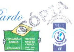
IMAGEM PRODUZIDA NO DIA DA LIVE

AUDIÊNCIA PÚBLICA TRANSMITIDA AO VIVO EM 23/07/2020